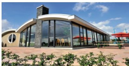
Vadesto Outdoor Adventure en Rondvaarten